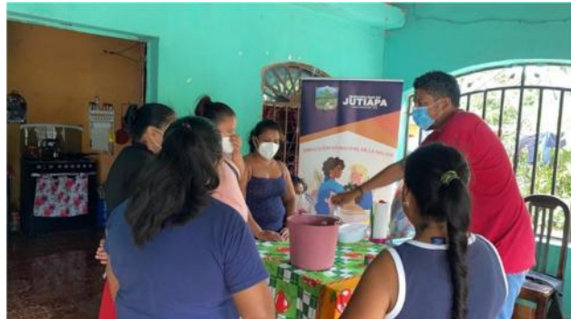
Organización de mujeres/ Unidades productivas en conjunto con SOSEP