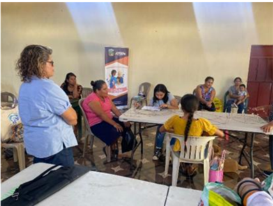
Curso de técnicas básicas para la elaboración de piñatas certificado por INTECAP-Jutiapa