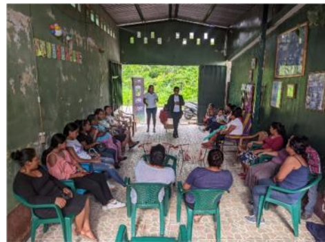
Proyecto textil "Aprende y emprende" TRANSFORMANDO TELAS CREAMDO SUEÑOS