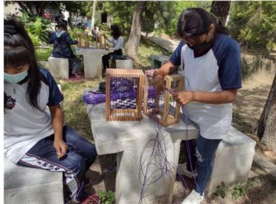
Curso de elaboración de cestas y bolsas plásticas certificado por INTECAP-Jutiapa