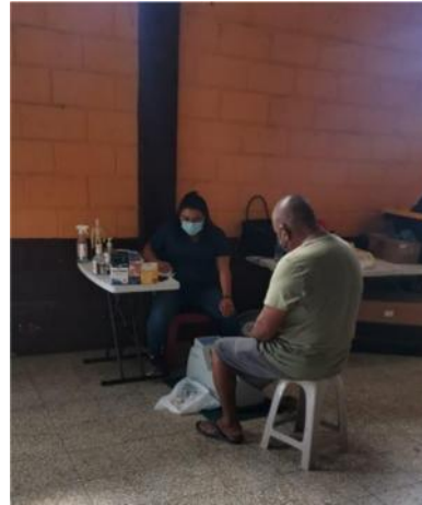
Jornada de Densitometría Ósea