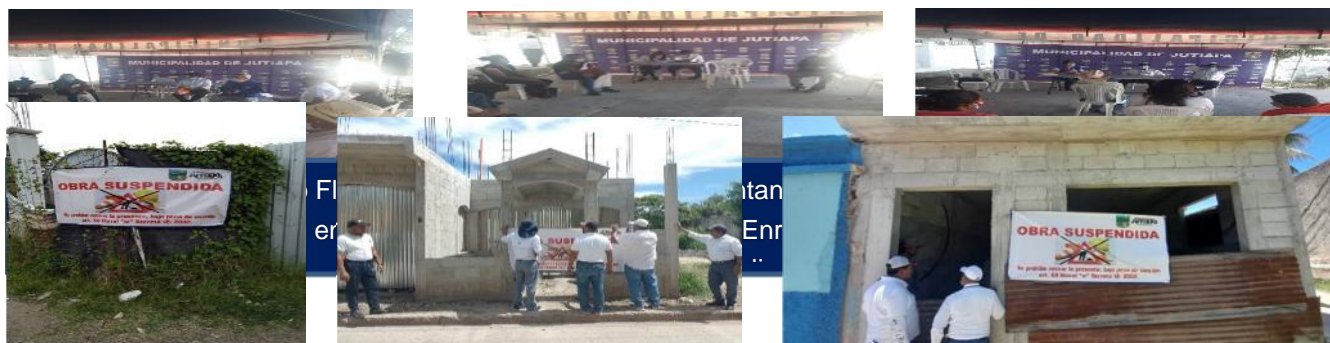
Como se observa en la fotografías se colocaron mantas de obras Suspendidas en las construcciones que no realizaron el pago correspondiente.

Para ello se incorporan fotografías y gráficas estadísticas correspondientes que ratifican las actividades por este Juzgado de Asuntos Municipales, siendo las siguientes: