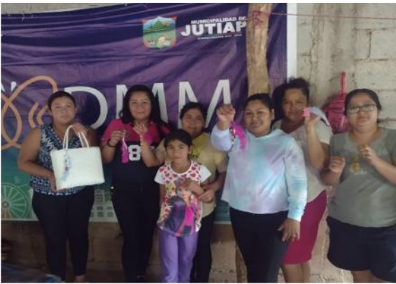
Talleres de bisutería