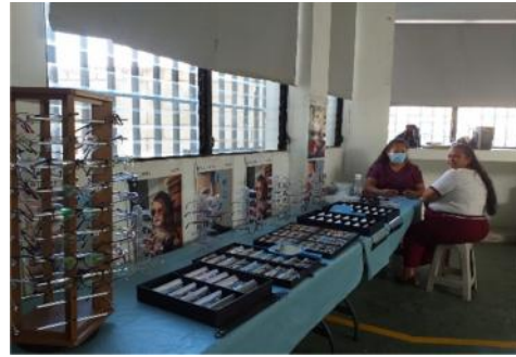
Jornada de Oftalmología