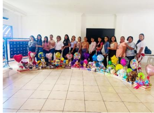
Curso de Diseño y decoración con globos certificado por INTECAP-Jutiapa